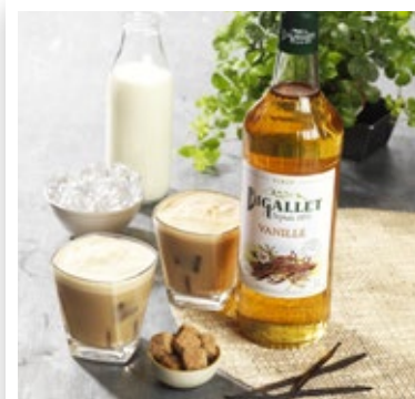
Café Frappé à la Vanille

Tendance café : Sublimez vos cafés avec nos sirops de noisette ou vanille, des incontournables des amateurs de saveurs gourmandes. Tendance thé glacé : découvrez nos nouveaux sirops thé pêche et thé vert menthe, pour des boissons rafraîchissantes et originales. Tendance bubble tea : Osez la différence avec notre sirop de citron vert gingembre.