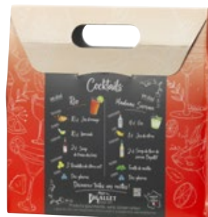
Fraise des Bois / Fleur de Sureau