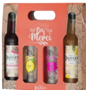
Framboise / Citron Jinot