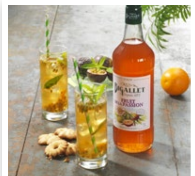
Thé Glacé Passion - Verveine