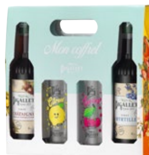
Châtaigne / Myrtille