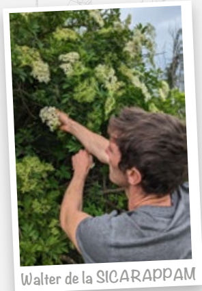
Walter de la SICARAPPAM

Après séchage, les fleurs de sureau sont mises en macération dans de l'alcool bio, puis distillées dans notre alambic en cuivre, afin d'en extraire les meilleurs arômes.