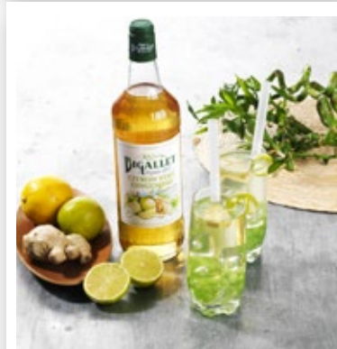
Bubble Tea Citron Vert - Gingembre