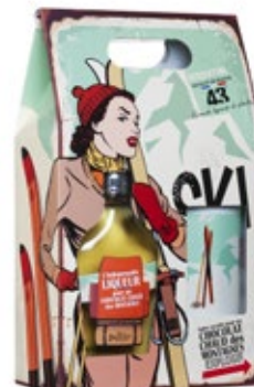
Un coffret explosif pour un chocolat chaud des montagnes.