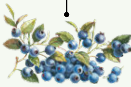
Cassis Drôme / Ardèche